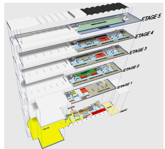
Bâtiment de 9 000 m 2 Longueur 117 mètres et largeur 17 mètres